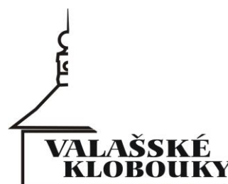
Město Valašské Klobouky